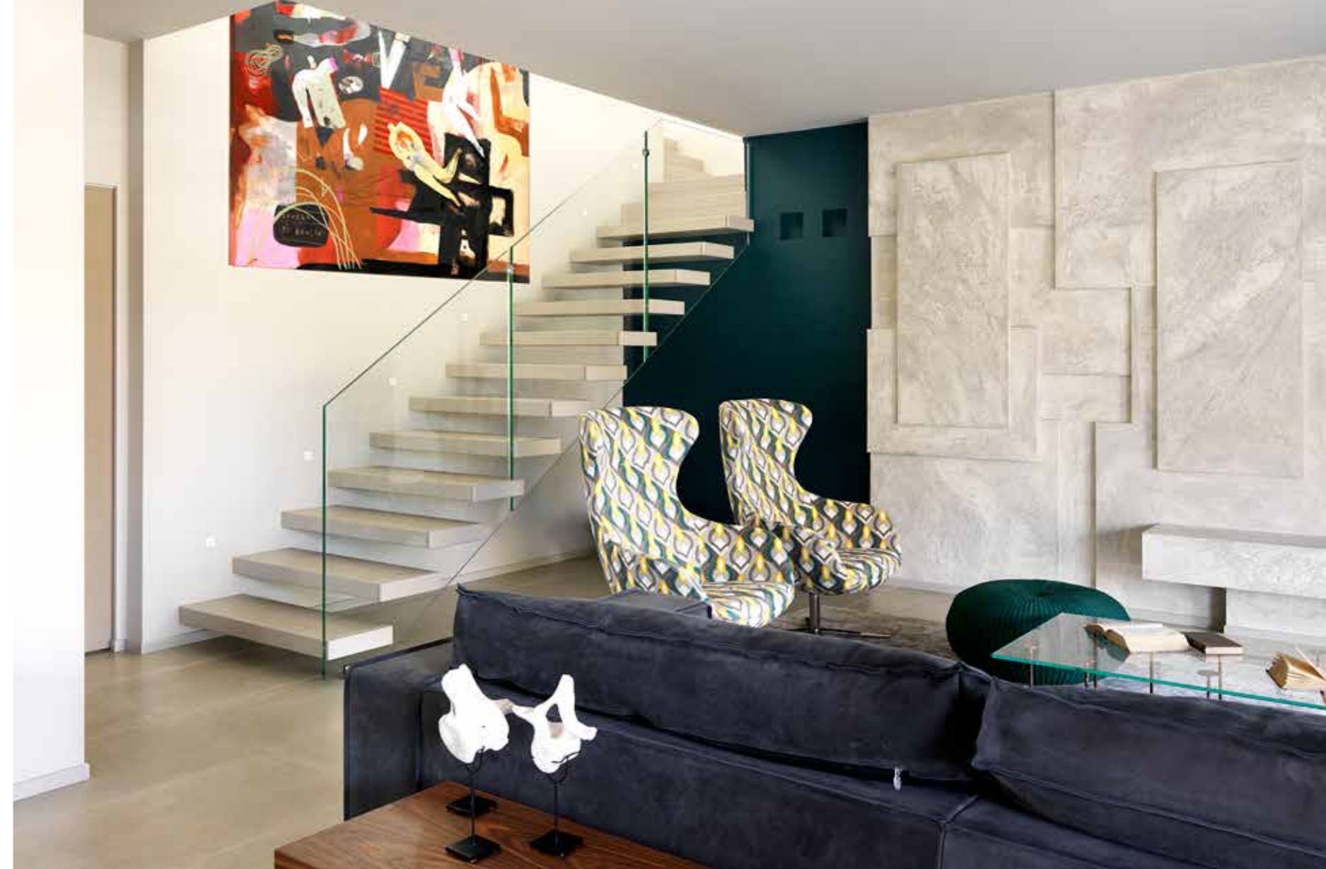
Il particolare volume realizzato in cartongesso con finitura in resina, disegnato a misura, il divano in pelle antracite e una coppia di poltrone in fantasia definiscono armoniosamente lo spazio living. A lato, lungo la parete, la scala con gradini a sbalzo (Far Arreda).