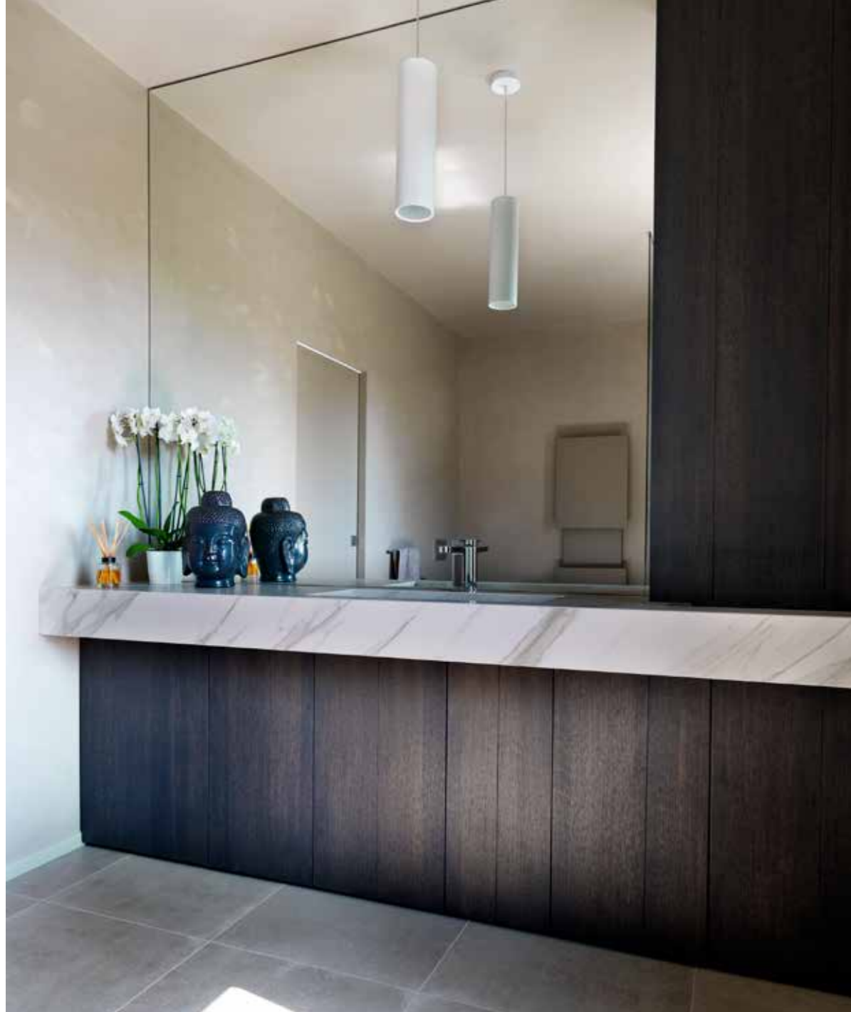
Realizzato a misura, con piano in kerlite e vasca integrata, il bagno ospiti rispecchia le caratteristiche della casa sia in linearità, che in eleganza (Far Arreda).