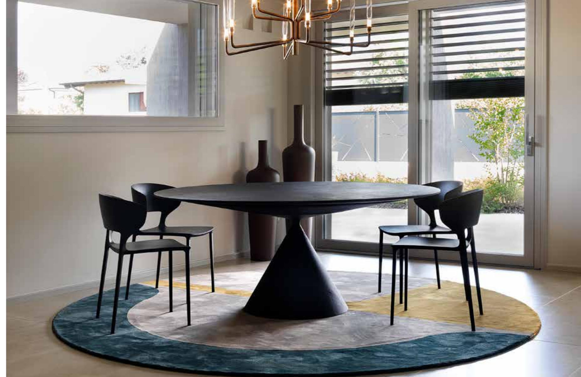
Nel luminoso open space l'area pranzo con affaccio sul giardino si frappono tra il living e la cucina: l'elegante tavolo rotondo in finitura stone pietra lavica, e le sedie poggiano sul morbido tappeto circolare, a ripresa sia della cromia della vicina coppia di credenze laccate verde Iseo sia della forma del grande specchio a parete in cui si riflette l'intera composizione. Elementi scenografici, la lampada a sfere e il lampadario (Far Arreda, Roncadelle - Bs).