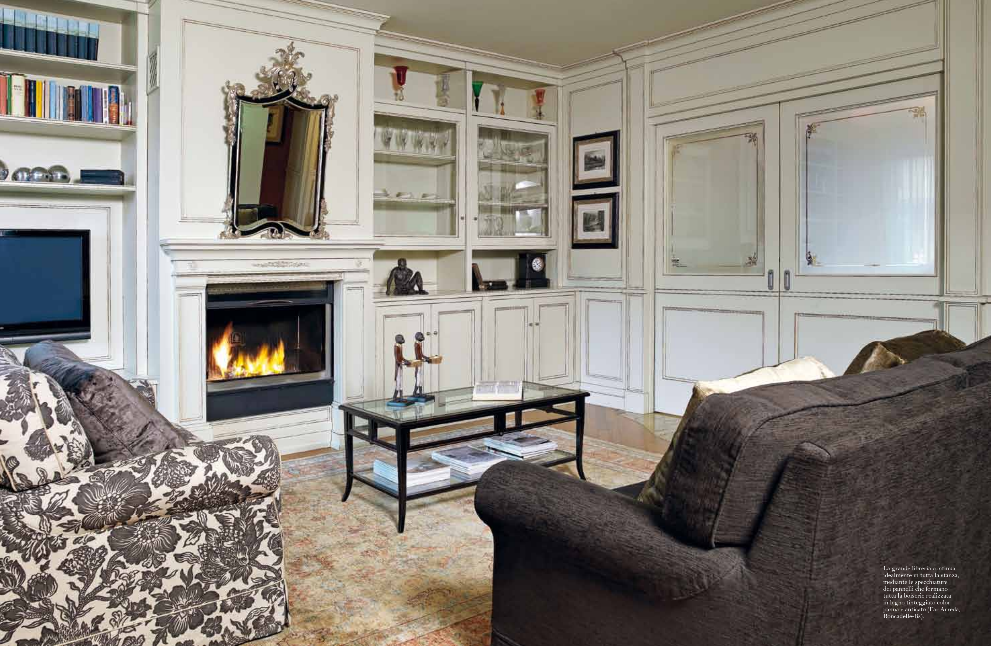
La grande libreria continua idealmente in tutta la stanza, mediante le specchiature dei pannelli che formano tutta la boiserie realizzata in legno tinteggiato color panna e anticato (Far Arreda, Roncadelle-Bs).