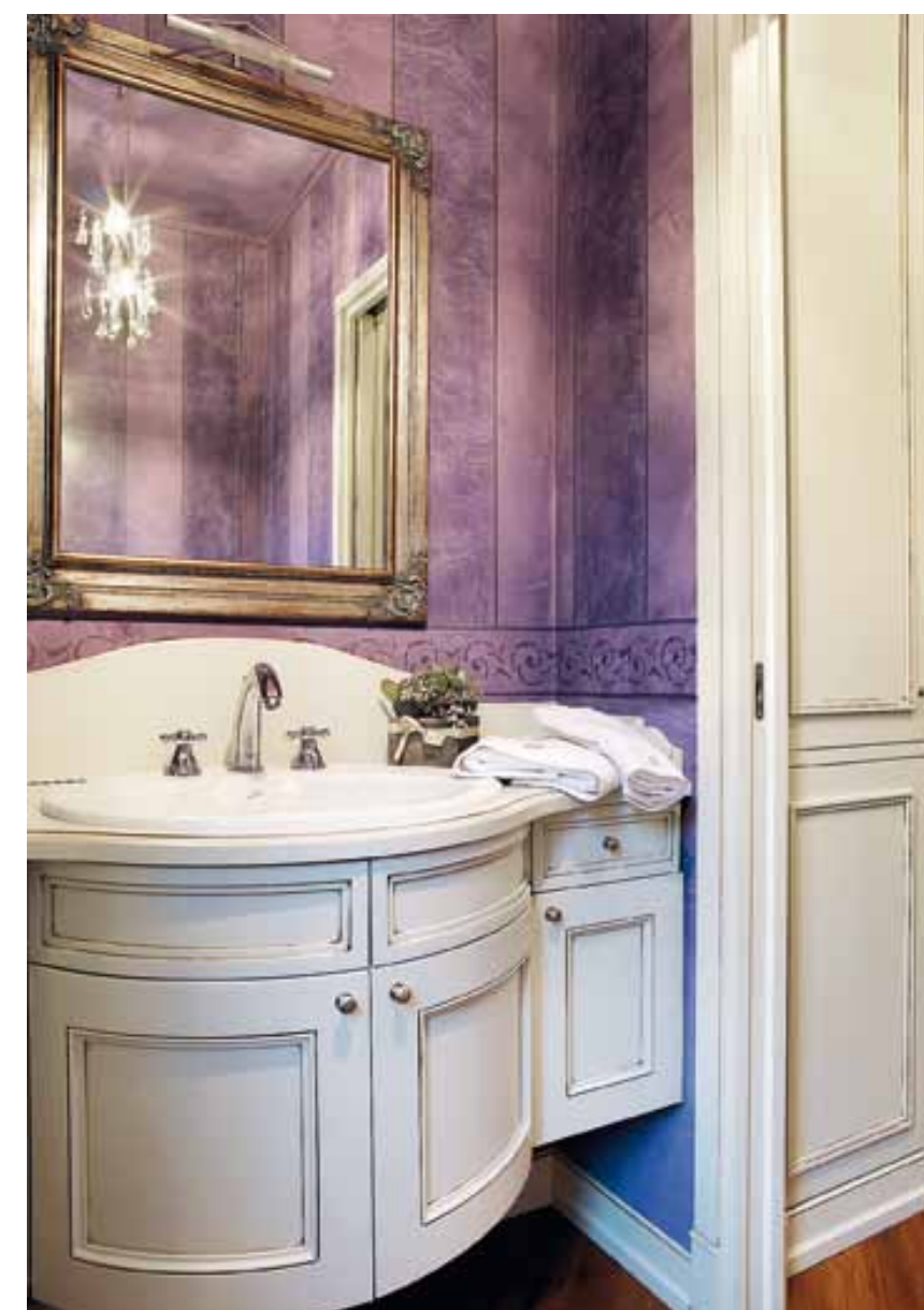
La camera da letto padronale dal colore viola brillante, ripreso anche nel bagno. L'utilizzo di un letto in foglia argenteo dalle linee in stile francese è una citazione del decorativismo francese con utilizzo di boiserie.