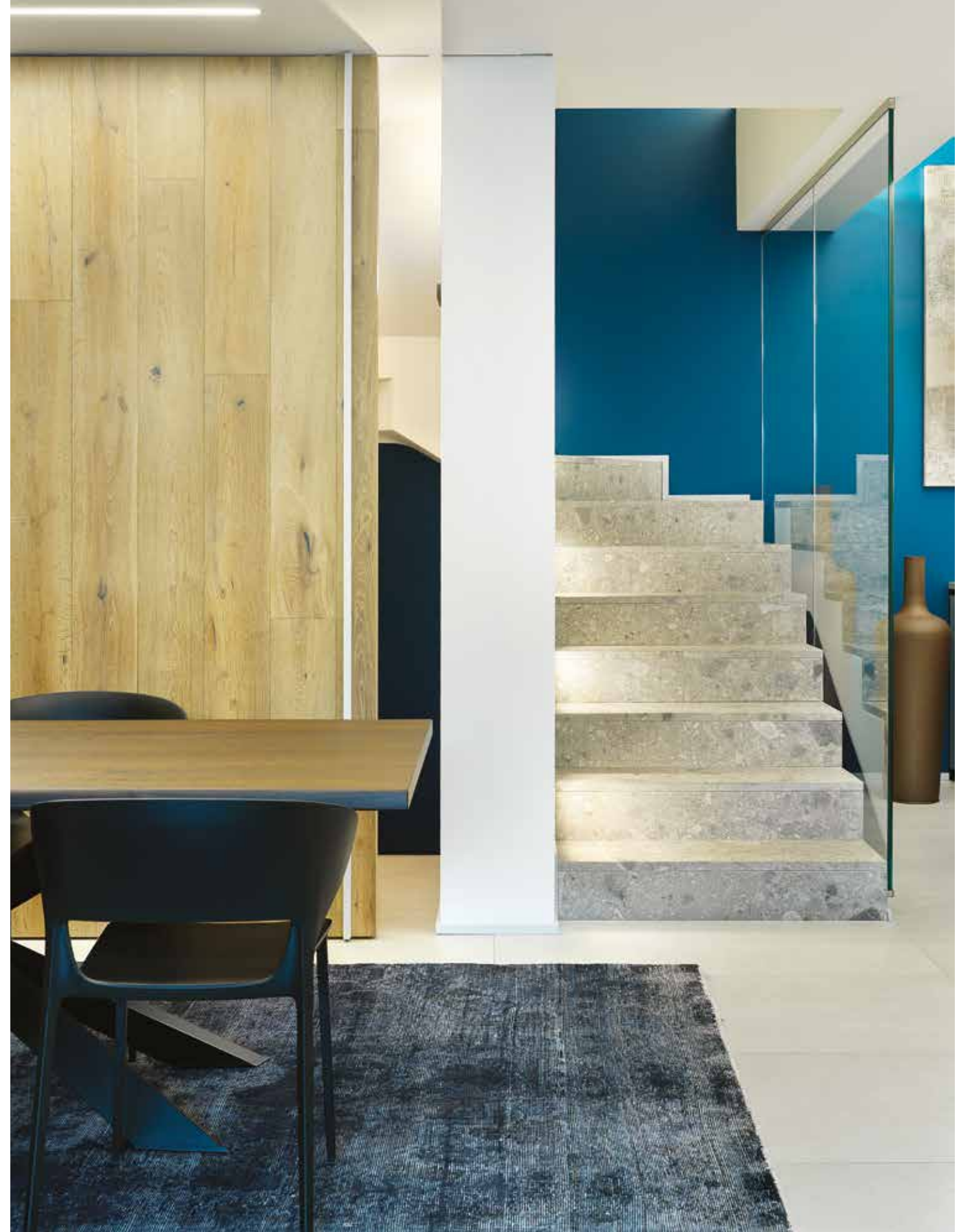
Alti pannelli scorrevoli di rovere aprono e chiudono gli accessi alle camerette e alla scala che conduce alla collezione privata di vini del piano interrato, grande passione del padrone di casa. Tali pannelli sono un elegante elemento decorativo così come le canne di bambù e i grandi quadri pittorici. Anche la scala realizzata con la pietra locale nota come "Ceppo di Gré", illuminata da segnapasso e chiusa da una parete di cristallo, si coordina alle cromie e all'arredo della zona giorno (Far Arreda).