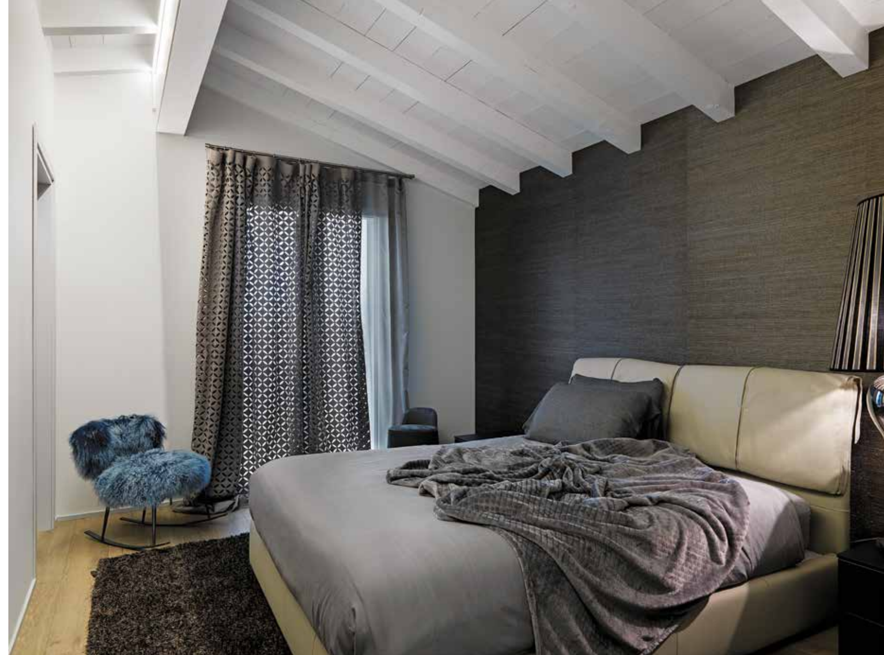
Tonalità di grigio scuro rivelano il carattere formale della camera padronale: alle spalle del letto in pelle, elegante parete rivestita in carta da parati in fibra naturale (Far Arreda).