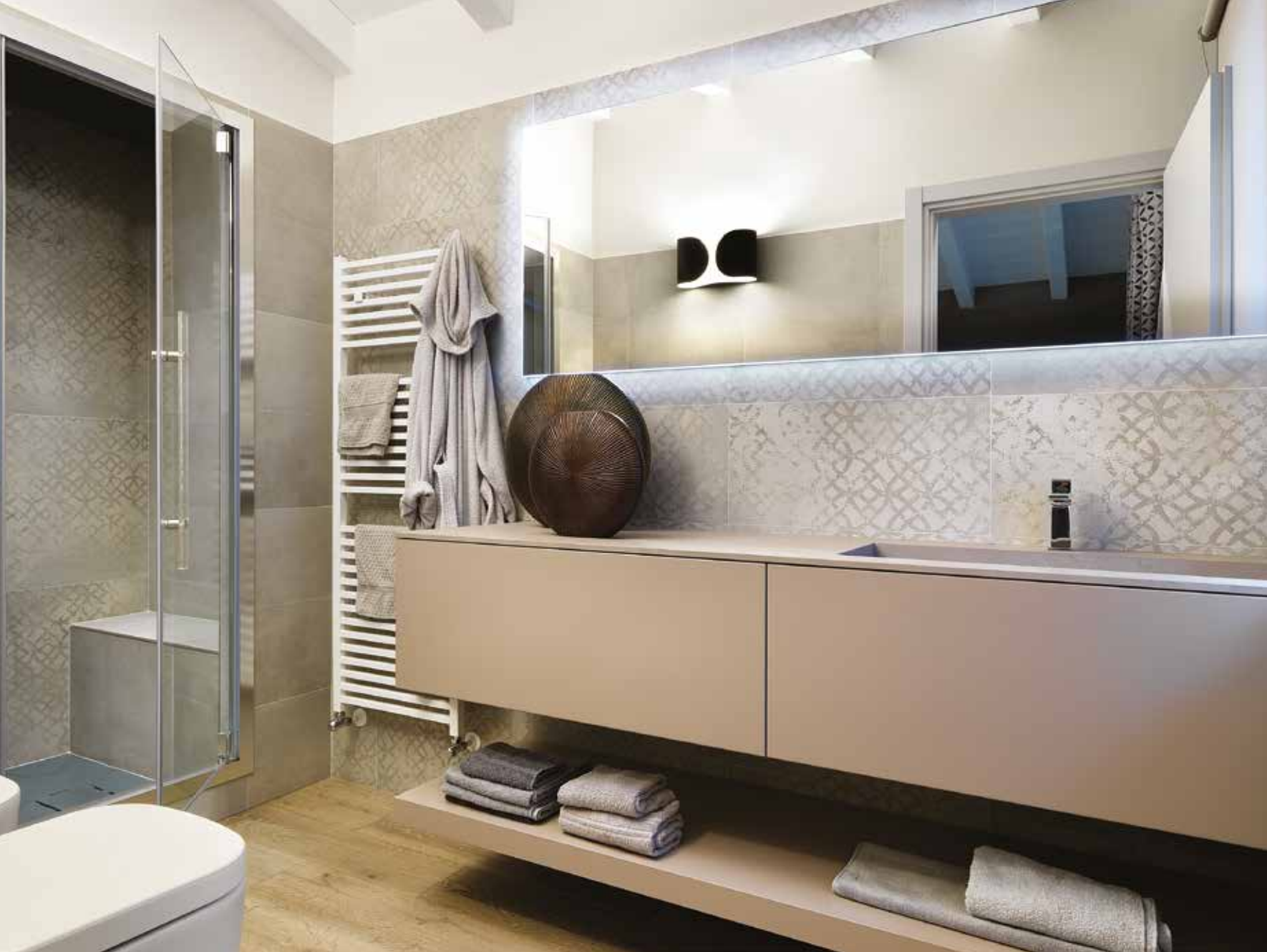
Nuance e sfumature grigie continuano nel bagno padronale, impreziosito dalla doccia con bagno turco e dal rivestimento a decori geometrici (Far Arreda).