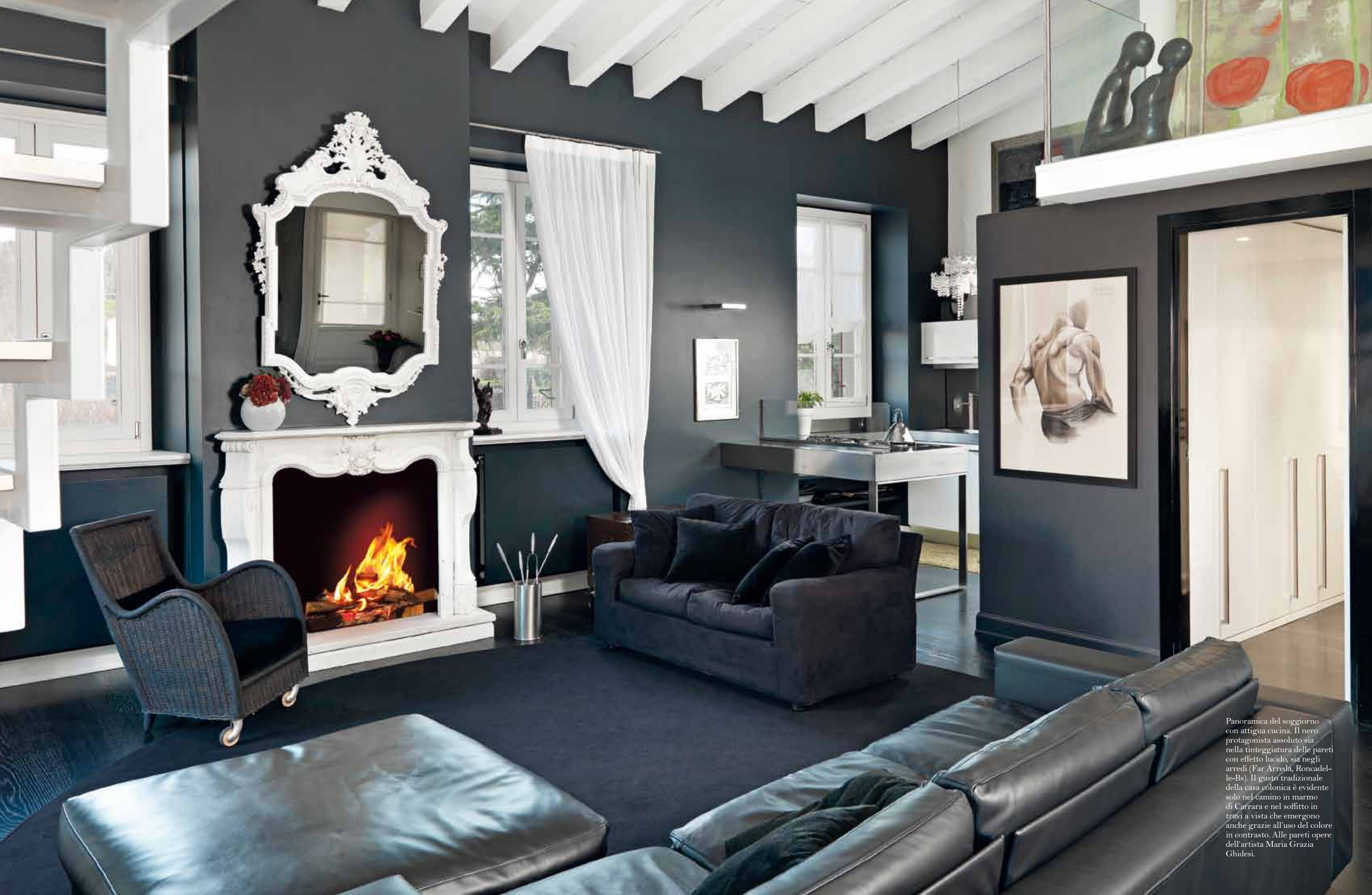
Panoramica del soggiorno con attigua cucina. Il nero protagonista assoluto sia nella tinteggiatura delle pareti con effetto lucido, sia negli arredi (Far Arreda, Roncadelle-Bs). Il gusto tradizionale della casa colonica è evidente solo nel camino in marmo di Carrara e nel soffitto in travi a vista che emergono anche grazie all'uso del colore in contrasto. Alle pareti opere dell'artista Maria Grazia Ghidese.