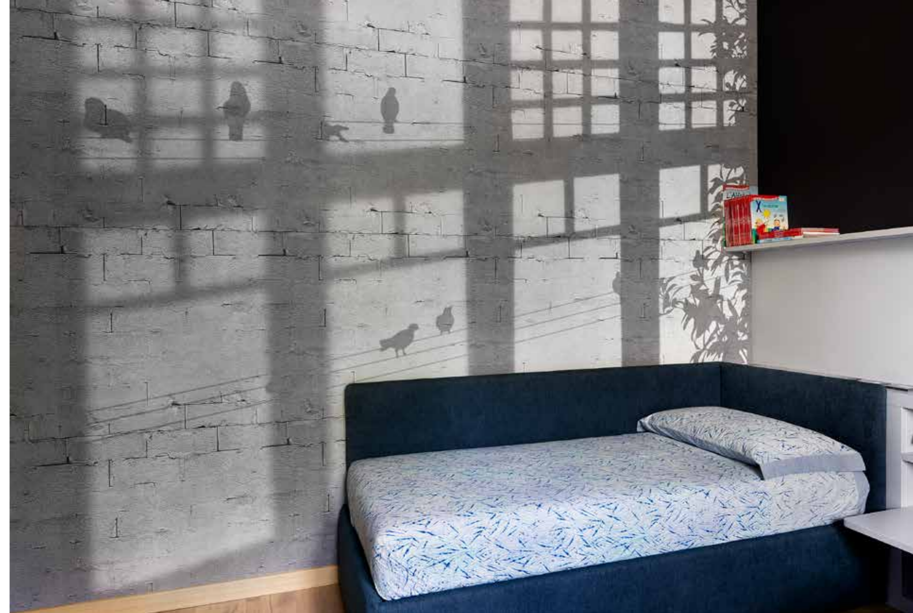
La delicata decorazione della carta da parati, che si accompagna al letto singolo in tessuto blu, conferisce personalità alla cameretta, creando un'atmosfera soffusa. Il grigio chiaro si lega quindi al bianco nel corrispettivo bagno ( Far Arreda ).