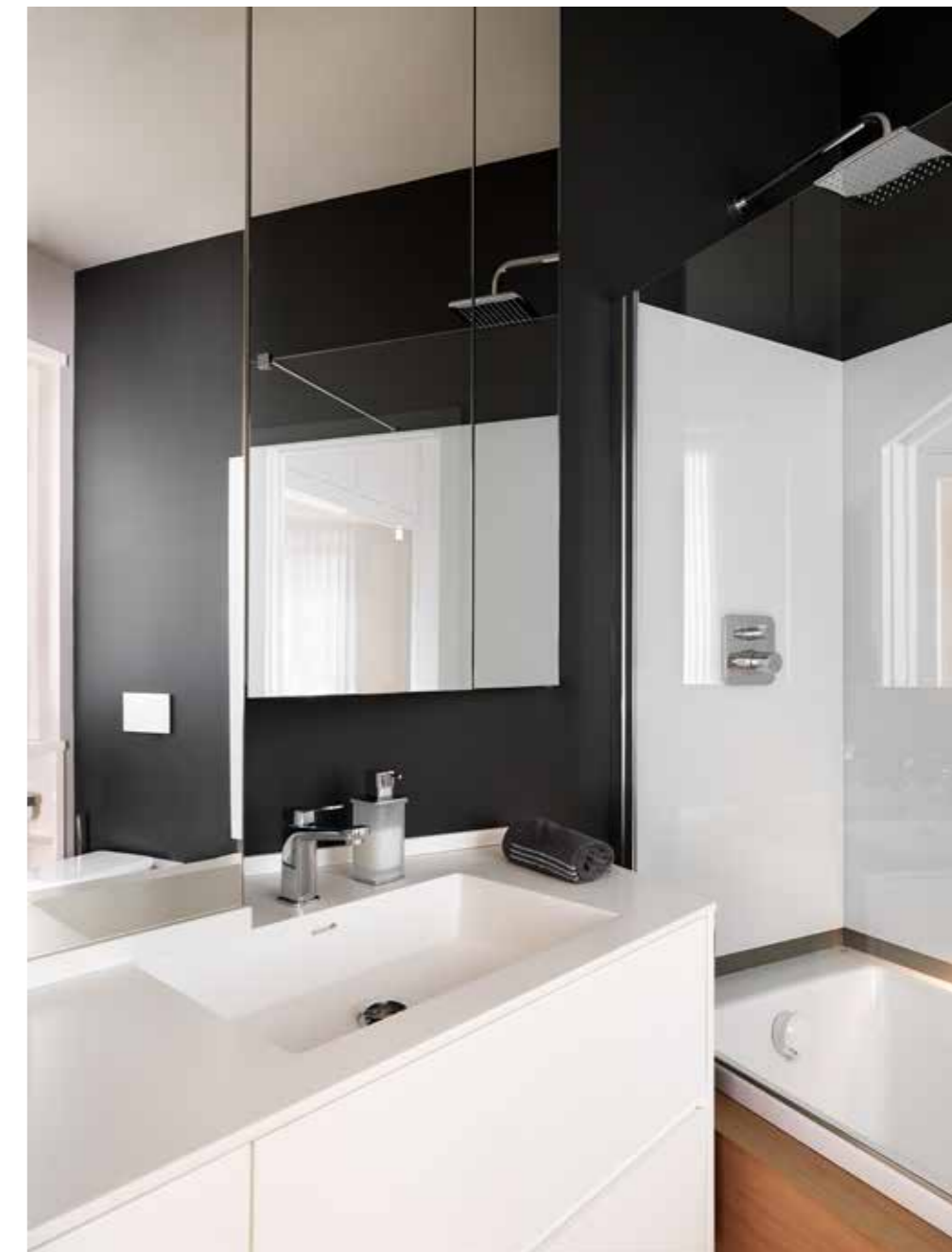
La camera padronale è una rigenerante suite privata, dotata di elegante bagno privato con vasca rivestita in legno e vetro verniciato bianco e sauna realizzata a filo dell'armadio laccato grigio ( Far Arreda ).