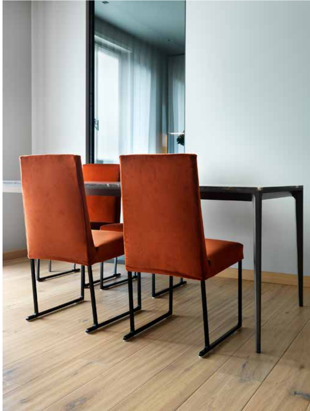
Due vetrate, delle quali una adibita a porta scorrevole, collegano la cucina all'area pranzo, creando un elegante disegno geometrico, di linee e cromie. Accanto alla finestra, tavolo con piano di marmo e sedie in velluto color ruggine. Nel controsoffitto, illuminazione con barre a led. Pavimento in legno di rovere ( Far Arreda ).