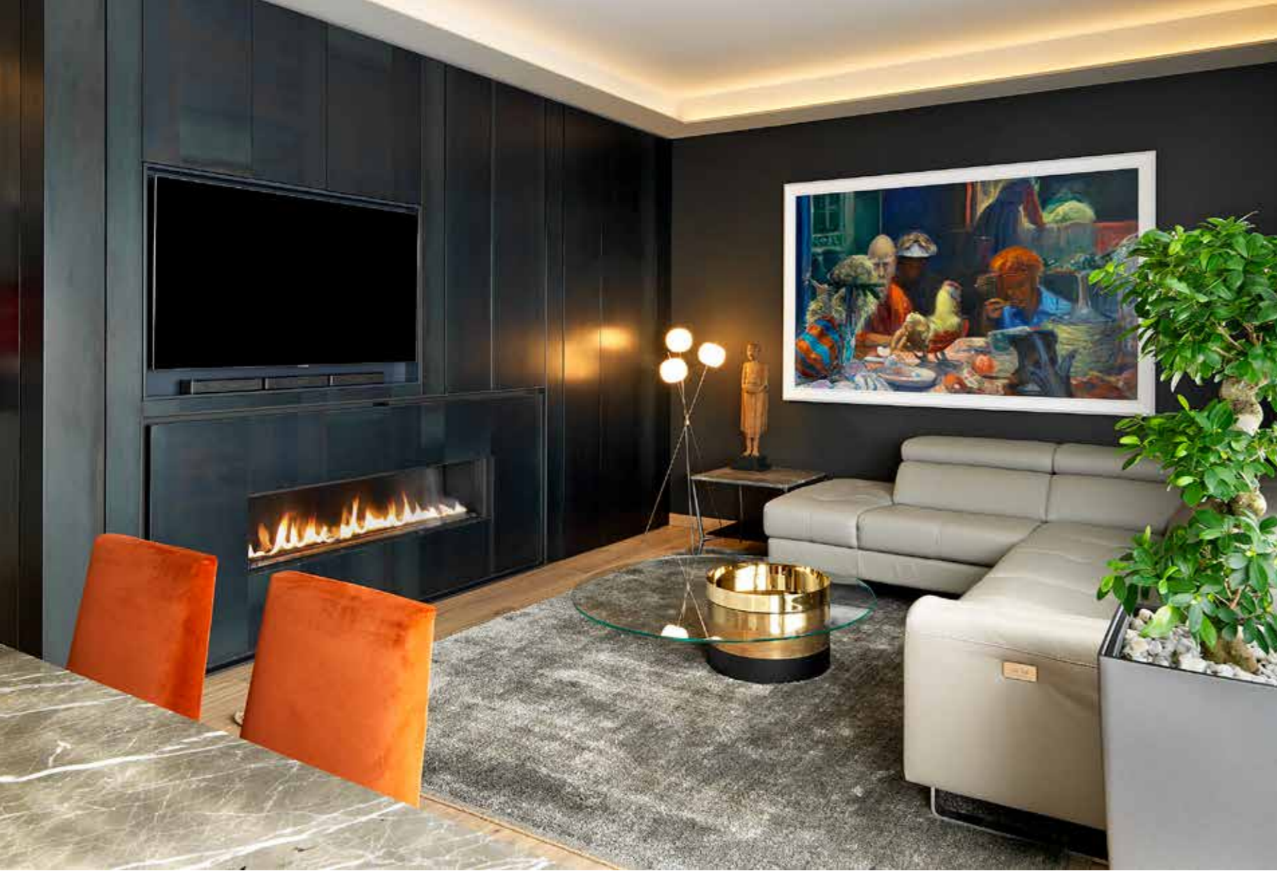
Nell'organizzato living, divano in pelle grigio chiaro, disposto a L, di fronte al camino, inserito nel raffinato mobile-divisorio con colonne contenitori, realizzato a misura e rivestito in lamiera. In angolo, lampada a tre sfere e tavolino con piano di marmo. Sul tappeto, tavolino in cristallo (Far Arreda) .

moderno paradiso terrestre, accoglie l'uomo del Nuovo Millennio.