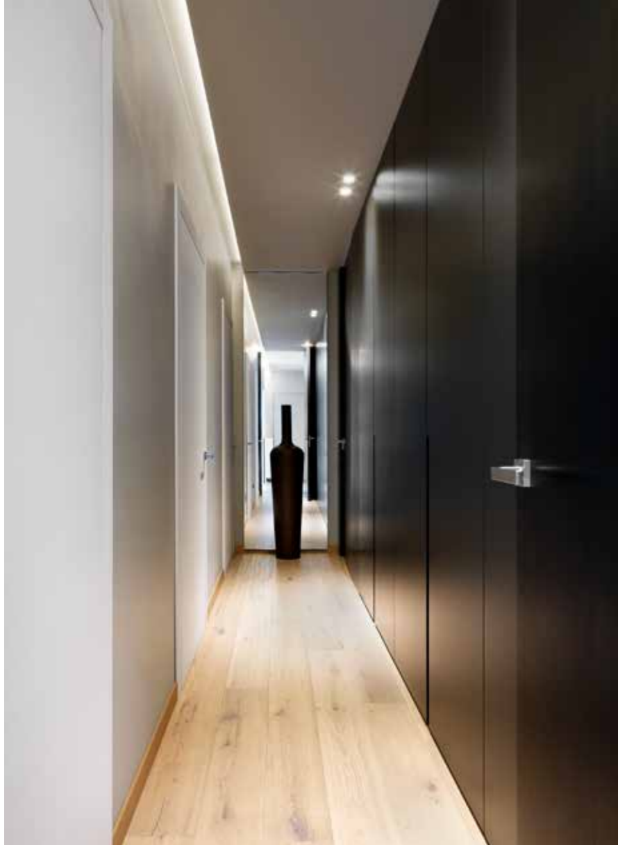
Accanto: inquadratura del corridoio: a lato, capiente armadio laccato moka, realizzato a misura; in fondo, specchio a parete che raddoppia visivamente lo spazio ( Far Arreda ). Sotto: nella camera padronale, moderno letto in tessuto grigio, in risalto sulla scura parete ( Far Arreda ).